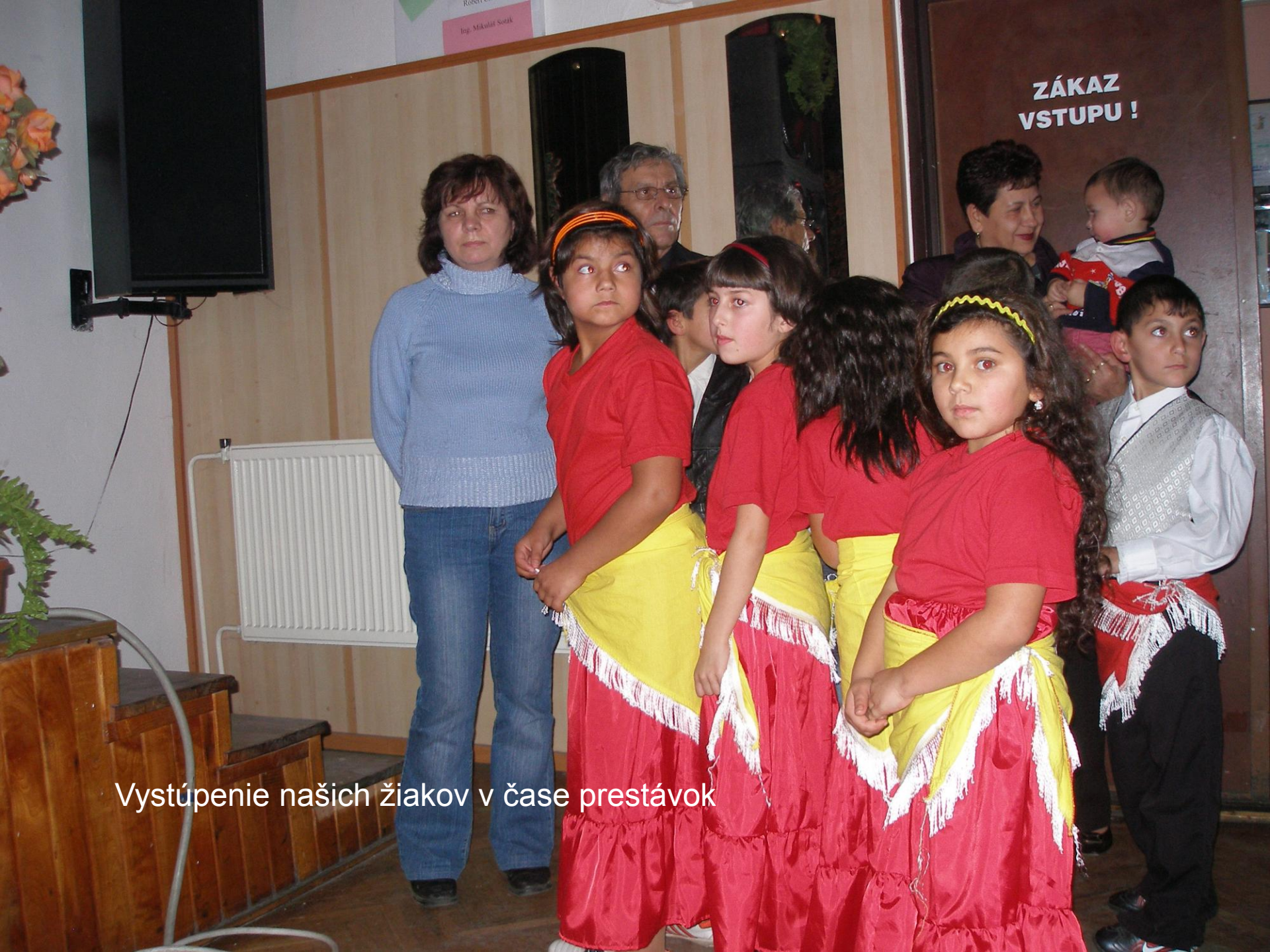
Vystúpenie našich žiakov v čase prestávok