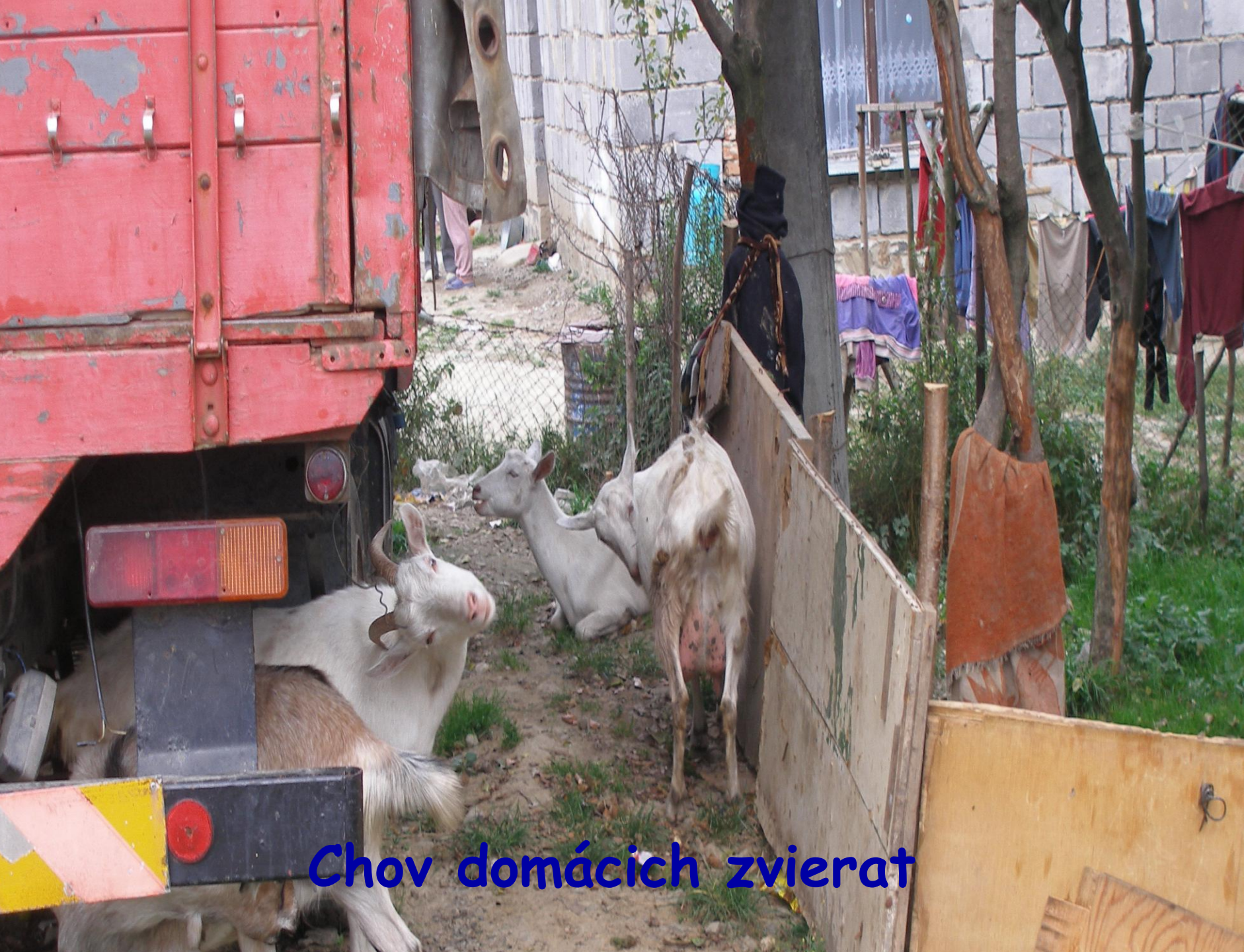
Chov domácich zvierat